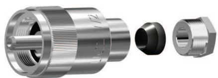
UC1-2-W1/R-5.0 UC1-2-W1/R-6.0 UC1-2-W1/R-7,5