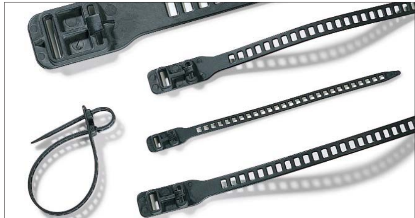
Elastyczność opasek SOFTFIX umożliwia stosowanie w wielu dziedzinach życia.

Uniwersalność opasek SOFTFIX umożliwia stosowanie w wielu dziedzinach. Miękki i giętki materiał nadaje się do stosowania przy wiązaniu i mocowaniu przewodów przesyłu danych oraz światłowodów. Elastyczność materiału pozwala na wykorzystanie także w rolnictwie, szkółkarstwie i sadownictwie.