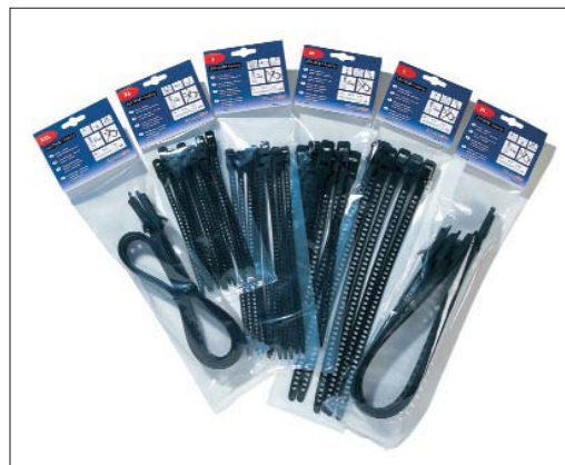
Opaski SOFTFIX są dostępne w małych opakowaniach.