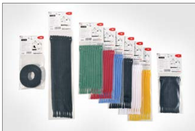
Die TEXTIE Serie ist in verschiedenen Farben und Längen erhältlich.