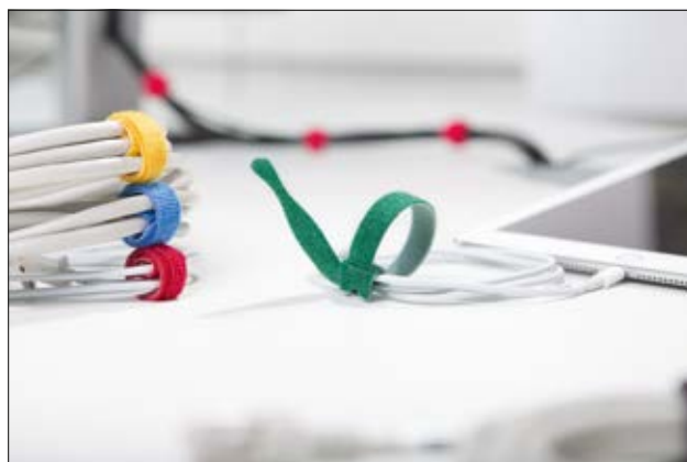
Durch das praktische Kabelbinderdesign kann der TEXTIE am Kabel verbleiben und geht nicht verloren.