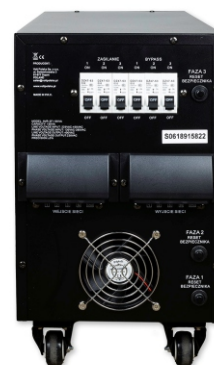
AVR PRO 15000VA 3% 3F