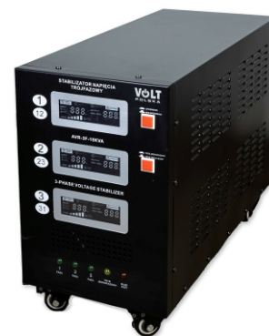
AVR PRO 15000VA 3% 3F