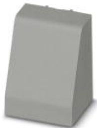
Einbaugehäuse, Farbe: grau, Breite: 17,5 mm

Bitte beachten Sie, dass die hier angegebenen Daten dem Online-Katalog entnommen sind. Die vollständigen Informationen und Daten entnehmen Sie bitte der Anwenderdokumentation. Es gelten die Allgemeinen Nutzungsbedingungen für Internet-Downloads. ( http://phoenixcontact.de/download )