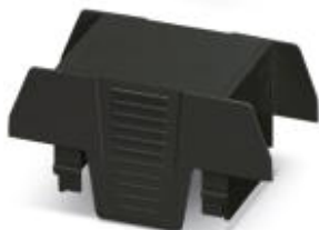
Einbaugehäuse, beidseitige Anschlussöffnung, Oberteil, Farbe: schwarz, Breite: 35 mm

Bitte beachten Sie, dass die hier angegebenen Daten dem Online-Katalog entnommen sind. Die vollständigen Informationen und Daten entnehmen Sie bitte der Anwenderdokumentation. Es gelten die Allgemeinen Nutzungsbedingungen für Internet-Downloads. ( http://phoenixcontact.de/download )