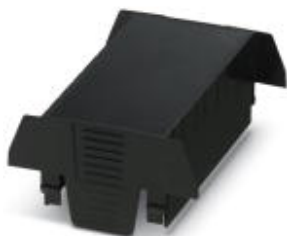
Einbaugeschützgehäuse, beidseitige Anschlussöffnung, Oberteil, Farbe: schwarz, Breite: 90 mm

Bitte beachten Sie, dass die hier angegebenen Daten dem Online-Katalog entnommen sind. Die vollständigen Informationen und Daten entnehmen Sie bitte der Anwenderdokumentation. Es gelten die Allgemeinen Nutzungsbedingungen für Internet-Downloads. ( http://phoenixcontact.de/download )