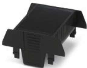
Einbaugehäuse, beidseitige Anschlussöffnung, Oberteil, Farbe: schwarz, Breite: 70 mm

Bitte beachten Sie, dass die hier angegebenen Daten dem Online-Katalog entnommen sind. Die vollständigen Informationen und Daten entnehmen Sie bitte der Anwenderdokumentation. Es gelten die Allgemeinen Nutzungsbedingungen für Internet-Downloads. ( http://phoenixcontact.de/download )