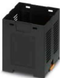
Einbaugehäuse, Farbe: schwarz, Breite: 70 mm

Bitte beachten Sie, dass die hier angegebenen Daten dem Online-Katalog entnommen sind. Die vollständigen Informationen und Daten entnehmen Sie bitte der Anwenderdokumentation. Es gelten die Allgemeinen Nutzungsbedingungen für Internet-Downloads. ( http://phoenixcontact.de/download )