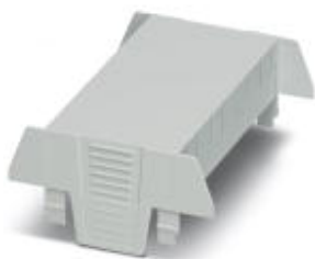
Einbaugehäuse, beidseitige Anschlussöffnung, Oberteil, Farbe: grau, Breite: 90 mm

Bitte beachten Sie, dass die hier angegebenen Daten dem Online-Katalog entnommen sind. Die vollständigen Informationen und Daten entnehmen Sie bitte der Anwenderdokumentation. Es gelten die Allgemeinen Nutzungsbedingungen für Internet-Downloads. ( http://phoenixcontact.de/download )