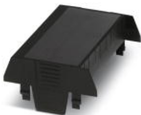
Einbaugehäuse, einseitige Anschlussöffnung, Oberteil, Farbe: schwarz, Breite: 90 mm

Bitte beachten Sie, dass die hier angegebenen Daten dem Online-Katalog entnommen sind. Die vollständigen Informationen und Daten entnehmen Sie bitte der Anwenderdokumentation. Es gelten die Allgemeinen Nutzungsbedingungen für Internet-Downloads. ( http://phoenixcontact.de/download )