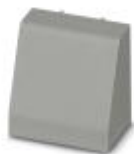
Einbaugehäuse, Farbe: grau, Breite: 22,5 mm

Blindstopfen - EH 22,5-FP/ABS GY7035 - 2201843