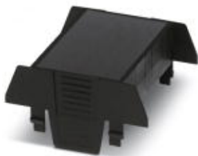
Einbaugeschützgehäuse, beidseitige Anschlussöffnung, Oberteil, Farbe: schwarz, Breite: 67,5 mm

Bitte beachten Sie, dass die hier angegebenen Daten dem Online-Katalog entnommen sind. Die vollständigen Informationen und Daten entnehmen Sie bitte der Anwenderdokumentation. Es gelten die Allgemeinen Nutzungsbedingungen für Internet-Downloads. ( http://phoenixcontact.de/download )