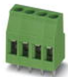
Leiterplattenklemme, Nennstrom: 24 A, Nennspannung: 400 V, Rastermaß: 5,08 mm, Polzahl: 12, Anschlussart: Schraubanschluss mit Zughülse, Montage: Wellenlöten, Anschlussrichtung Leiter/Platine: 0 °, Farbe: grün. Der Artikel ist zu unterschiedlichen Polzahlen anreihbar!

Leiterplatten-Anschlussklemme - MKDS 3/12-5,08 - 1714308