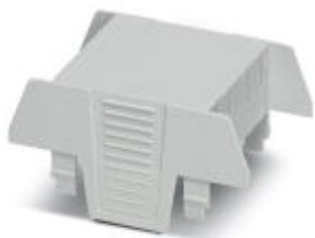
Einbaugeschäuse, beidseitige Anschlussöffnung, Oberteil, Farbe: grau, Breite: 45 mm

Bitte beachten Sie, dass die hier angegebenen Daten dem Online-Katalog entnommen sind. Die vollständigen Informationen und Daten entnehmen Sie bitte der Anwenderdokumentation. Es gelten die Allgemeinen Nutzungsbedingungen für Internet-Downloads. ( http://phoenixcontact.de/download )