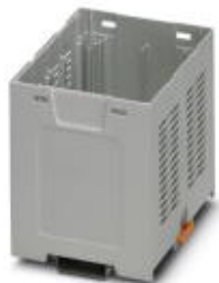
Einbaugeschäft, Farbe: grau, Breite: 90 mm

Bitte beachten Sie, dass die hier angegebenen Daten dem Online-Katalog entnommen sind. Die vollständigen Informationen und Daten entnehmen Sie bitte der Anwenderdokumentation. Es gelten die Allgemeinen Nutzungsbedingungen für Internet-Downloads. ( http://phoenixcontact.de/download )