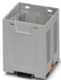
Einbaugeschäft, Farbe: grau, Breite: 67,5 mm

Bitte beachten Sie, dass die hier angegebenen Daten dem Online-Katalog entnommen sind. Die vollständigen Informationen und Daten entnehmen Sie bitte der Anwenderdokumentation. Es gelten die Allgemeinen Nutzungsbedingungen für Internet-Downloads. ( http://phoenixcontact.de/download )