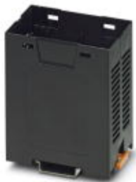
Einbaugeschäft, Farbe: schwarz, Breite: 45 mm

Bitte beachten Sie, dass die hier angegebenen Daten dem Online-Katalog entnommen sind. Die vollständigen Informationen und Daten entnehmen Sie bitte der Anwenderdokumentation. Es gelten die Allgemeinen Nutzungsbedingungen für Internet-Downloads. ( http://phoenixcontact.de/download )