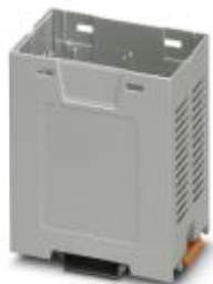
Einbaugeschäft, Farbe: grau, Breite: 45 mm

Bitte beachten Sie, dass die hier angegebenen Daten dem Online-Katalog entnommen sind. Die vollständigen Informationen und Daten entnehmen Sie bitte der Anwenderdokumentation. Es gelten die Allgemeinen Nutzungsbedingungen für Internet-Downloads. ( http://phoenixcontact.de/download )