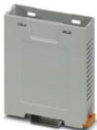
Einbaugeschäft, Farbe: grau, Breite: 22,5 mm

Bitte beachten Sie, dass die hier angegebenen Daten dem Online-Katalog entnommen sind. Die vollständigen Informationen und Daten entnehmen Sie bitte der Anwenderdokumentation. Es gelten die Allgemeinen Nutzungsbedingungen für Internet-Downloads. ( http://phoenixcontact.de/download )