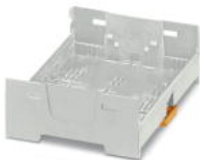
Einbaugeschäft, Farbe: grau, Breite: 90 mm

Bitte beachten Sie, dass die hier angegebenen Daten dem Online-Katalog entnommen sind. Die vollständigen Informationen und Daten entnehmen Sie bitte der Anwenderdokumentation. Es gelten die Allgemeinen Nutzungsbedingungen für Internet-Downloads. ( http://phoenixcontact.de/download )