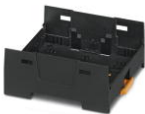
Einbaugeschäft, Farbe: schwarz, Breite: 67,5 mm

Bitte beachten Sie, dass die hier angegebenen Daten dem Online-Katalog entnommen sind. Die vollständigen Informationen und Daten entnehmen Sie bitte der Anwenderdokumentation. Es gelten die Allgemeinen Nutzungsbedingungen für Internet-Downloads. ( http://phoenixcontact.de/download )