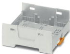
Einbaugeschäft, Farbe: grau, Breite: 67,5 mm

Bitte beachten Sie, dass die hier angegebenen Daten dem Online-Katalog entnommen sind. Die vollständigen Informationen und Daten entnehmen Sie bitte der Anwenderdokumentation. Es gelten die Allgemeinen Nutzungsbedingungen für Internet-Downloads. ( http://phoenixcontact.de/download )