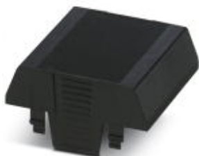
Einbaugehäuse, ohne Anschlussöffnung, Oberteil, Farbe: schwarz, Breite: 70 mm

Bitte beachten Sie, dass die hier angegebenen Daten dem Online-Katalog entnommen sind. Die vollständigen Informationen und Daten entnehmen Sie bitte der Anwenderdokumentation. Es gelten die Allgemeinen Nutzungsbedingungen für Internet-Downloads. ( http://phoenixcontact.de/download )