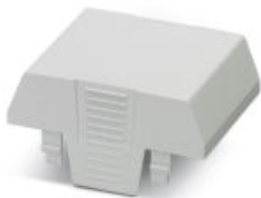
Einbaugehäuse, ohne Anschlussöffnung, Oberteil, Farbe: grau, Breite: 52,5 mm

Bitte beachten Sie, dass die hier angegebenen Daten dem Online-Katalog entnommen sind. Die vollständigen Informationen und Daten entnehmen Sie bitte der Anwenderdokumentation. Es gelten die Allgemeinen Nutzungsbedingungen für Internet-Downloads. ( http://phoenixcontact.de/download )