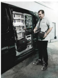
Wera 2go 1 - Narzędzia na zewnątrz